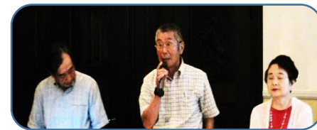
大山口列車空襲被災者の会の方々