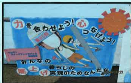
オムロンスイッチアンドデバイス労働組合