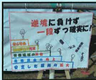
中電ユニオン倉吉営業所支部