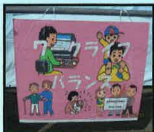
倉吉市職員労働組合