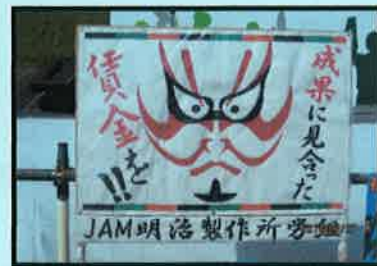
明治製作所労働組合