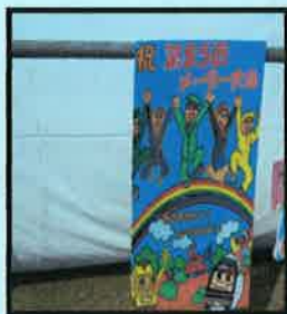
私鉄日ノ丸倉吉分会