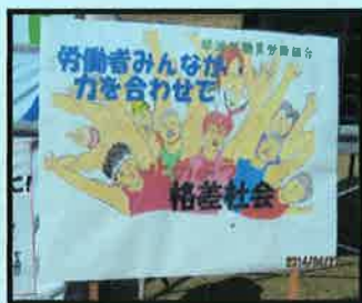
琴浦町職員労働組合