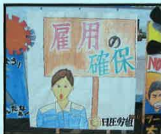
日圧スーパーテクノロジーズ労働組合