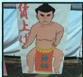
神鋼機器工業労働組合